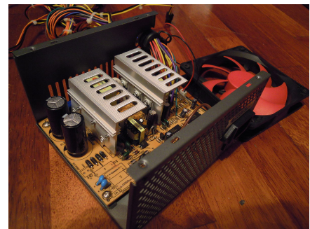
Fuente de alimentación para PC formato ATX (sin cubierta superior, para mostrar su interior y con el ventilador a un lado).

Una fuente conmutada es un dispositivo electrónico que transforma energía eléctrica mediante transistores en conmutación. Mientras que un regulador de tensión utiliza transistores polarizados en su región activa de amplificación, las fuentes conmutadas utilizan los mismos conmutándolos activamente a altas frecuencias (20-100 kHz típicamente) entre corte (abiertos) y saturación (cerrados). La forma de onda cuadrada resultante es aplicada a transformadores con núcleo de ferrita (Los núcleos de hierro no son adecuados para estas altas frecuencias) para obtener uno o varios voltajes de salida de corriente alterna (CA) que luego son rectificadas (Con diodos rápidos) y filtrados (inductores y condensadores) para obtener los voltajes de salida de corriente continua (CC). Las ventajas de este método incluyen menor tamaño y peso del núcleo, mayor eficiencia y por lo tanto menor calentamiento. Las desventajas comparándolas con fuentes lineales es que son mas complejas y generan ruido eléctrico de alta frecuencia que debe ser cuidadosamente minimizado para no causar interferencias a equipos próximos a estas fuentes.